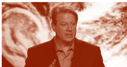
Al Gore, nositeľ Nobelovej ceny za mier za rok 2007

blahobyt, národ, rasa alebo ochrana prírody. Ak sloboda môže byť legitímne potláčaná v záujme vyššieho cieľa, tak sloboda potlačaná bude.