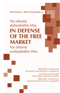
Na obranu slobodného trhu (2007)

Texty prednášok sú zamerané na problémy súvisiace s centrálnym regulovaním trhu a na predpoklady fungovania spontánneho poriadku v spoločnosti. Ich spoločným odrazovým mostíkom je učenie Adama Smitha o spontánne fungujúcej spoločnosti na báze individuálneho záujmu a „neviditeľnej ruky trhu“ v procese výmen a etických noriem so zainteresovanosťou na osu-